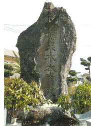
木本橋梁の墓 (尋声寺墓地)

明治時代の画人。江戸末期の文政11年(1828年)三佐板屋町に生まれ、18歳のとき竹田の森崎谷について水墨画を学び、後に京阪や長崎を遊歴し、技を練りました。明治21年(1888年)60歳で亡くなっています。三佐校区公民館に作品の一つが飾られています。