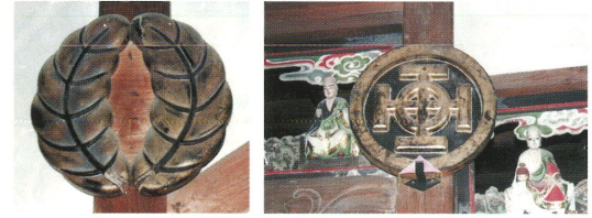
御座船紋章 (尋声寺・海潮寺・太刀振神社)

岡藩主中川侯が参勤交代に使った御座船「住吉丸」などの船体に付けてあった「中川柏」と「中川久留子(クルス)」の丸い紋章が三佐の寺に奉納されています。特に、中川の紋章を寺紋として許された尋声寺には、多く紋章が貴重な文化財として保存されています。