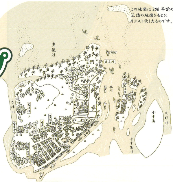
この地図は200年前の三佐の地図をもとにイラスト化したものです。